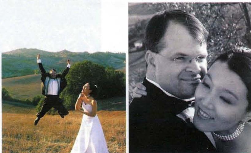
葡萄园里,让毛豆数到一时凝神托腮,数到二时痴痴怪笑,同时马克必须候分克数地做蛙跳。这也是为数不多的“摆谱”照片之一。